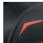
Protection de l'embout de sécurité avec encoche pour coutures