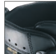
Fermeture de tige