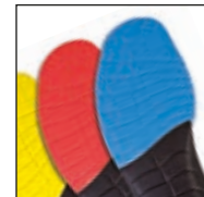
Vario Wide Fit System