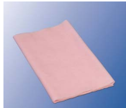
Gaze imprégnée en viscosse (101269)