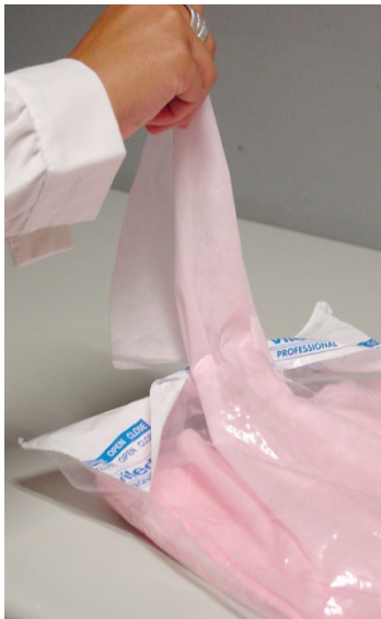
Gaze imprégnée en polypropylène (100553 - 101272)

Les gazes à usage unique pour le dépeussierage des sols